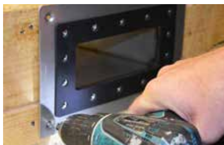
2. Montare troppo pieno