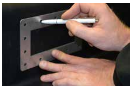
4. Bordo interno del profilo estruso (bordo preciso troppo pieno) e marcatura completa dei fori delle viti