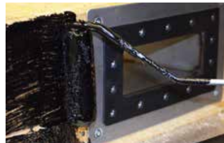
3. Incollare l'impermeabilizzazione secondo le norme. ATTENZIONE: nessuna saldatura nel profilo estruso