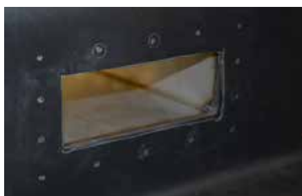
5. Incidere una croce, forare le estremità del taglio, tagliare a forma rettangolare