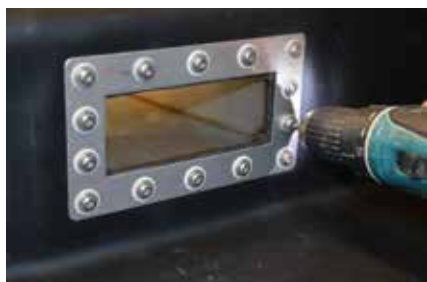
7. Montare il profilo estruso Utilizzare solo le viti fornite con l'anello di tenuta