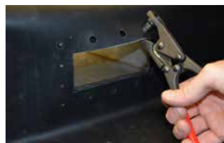
6. Realizzare i fori marcati con pinza punzonatrice 10 mm