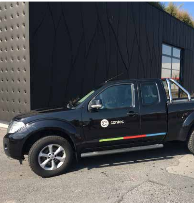
Bereit für den Einsatz; das Servicetechniker-Team.