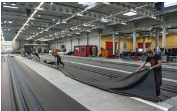
Auslegen & schweißen der Bahnsegmente

Tetti complessi: il lavoro giusto per Contec Più un tetto è complicato, più parla a favore di Contec. La produzione prefabbricata in stabilimento dei tanti dettagli permette di risparmiare tempo e denaro durante l'installazione.