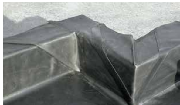
Ausbildung von Ecken