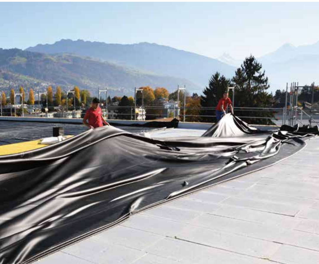
Entfalten und ausrichten

I lavori di impermeabilizzazione possono essere molto dispendiosi in termini di tempo e impegnativi in termini di lavoro e – a seconda delle condizioni climatiche – possono essere snervanti. Non è così con Contec: grazie al fatto che viene prefabbricata, infatti, l'impermeabilizzazione può essere installata nel rispetto delle scadenze anche se, per lungo tempo, permangono condizioni climatiche sfavorevoli. L'applicazione è talmente rapida che non si rendono necessarie né opere provvisorie né lavori in economia. Nella maggior parte dei casi è sufficiente un giorno per avere il tetto perfettamente impermeabilizzato.