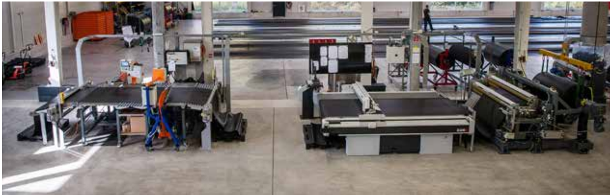
Zuschneiden der Bahnen

La prefabbricazione nei minimi dettagli — Consegniamo in cantiere impermeabilizzazioni prefabbricate realizzate su misura fino al 95%. Si tratta di una tecnica unica nel suo genere a livello mondiale.