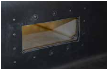
5. Faites une entaille en forme de croix, poinçonnez les extrémités découpées, finissez de découper à angle droit