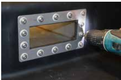
7. Montez le profil extrudé N'utilisez que les vis à bague d'étanchéité faisant partie de la livraison