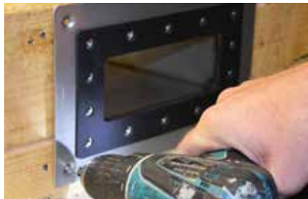
2. Montez le trop-plein