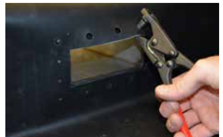
6. Poinçonnez les trous marqués avec une poinçonneuse de 10 mm