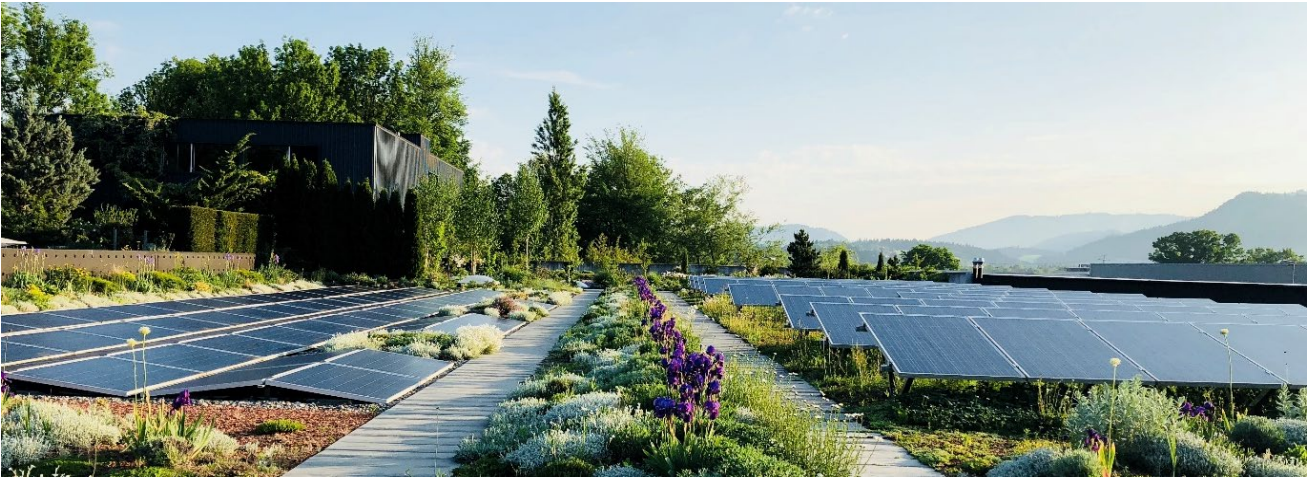
Contec AG, Lagerhalle, Uetendorf