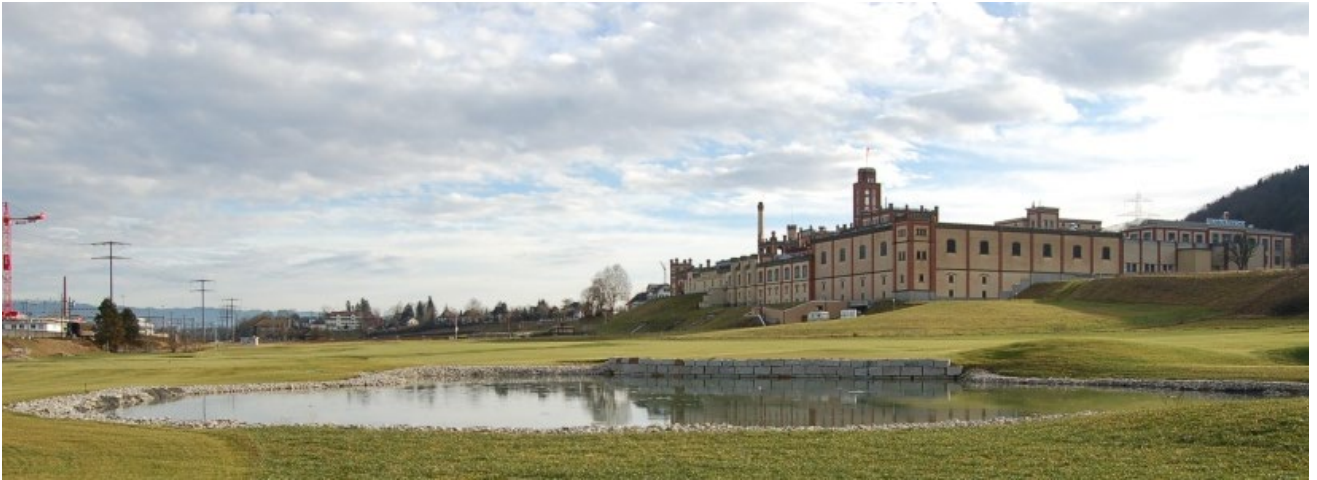
Terrain de golf, Rheinfelden