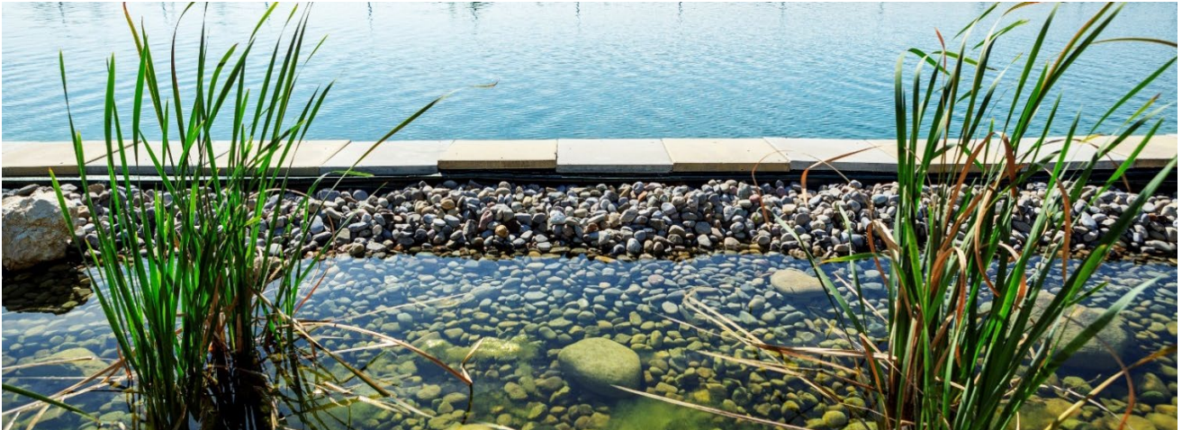
Meteorbecken, Mäder Kräuter AG, Boppelsen