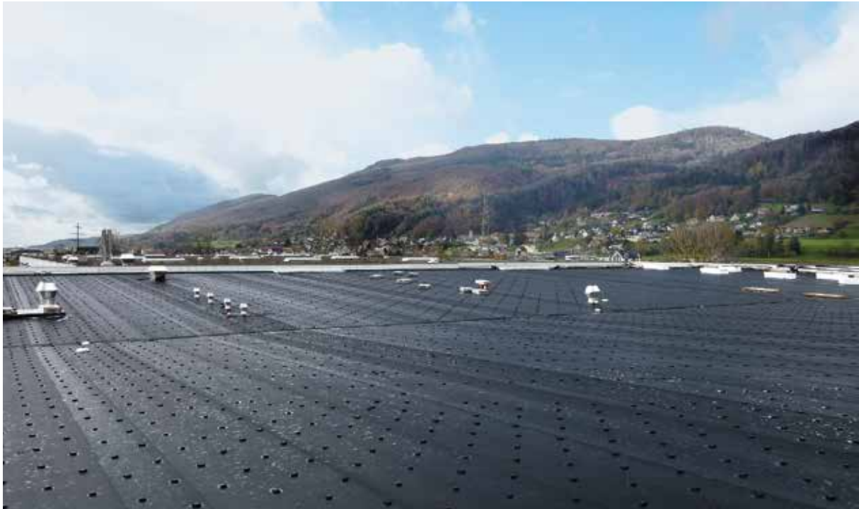
Mögliche Befestigungsverfahren: Contec.fix Klemmhalter, Contec.fix Induktio, Lineare Befestigung