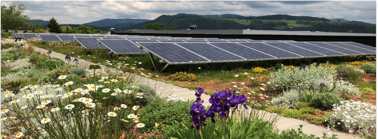
Contec AG, Uetendorf