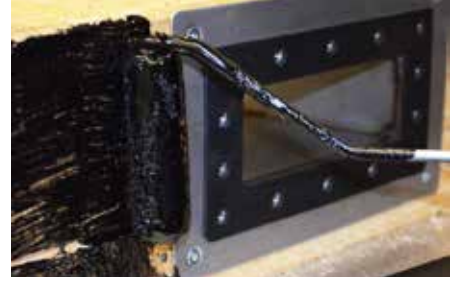
3. Abdichtung gemäss Vorschrift kleben. ACHTUNG: keine Naht im Pressprofil