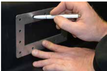
4. Innenkante des Pressprofils (passgenaue Kante Notüberlauf) und Schraubenlöcher vollflächig markieren