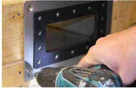
2. Notüberlauf montieren