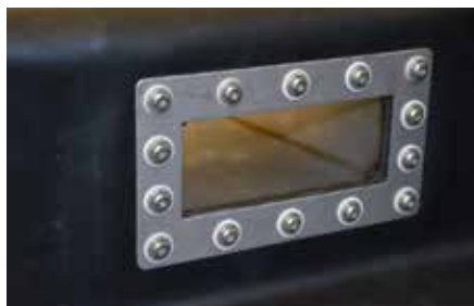
8. Fertig verschrauben Drehmoment 8 N/m

Fragen? Rufen Sie uns an: Kundendienst Service & Qualitätssicherheit: 033 346 06 80