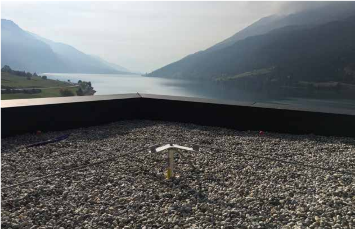
Auch für Kiesdächer